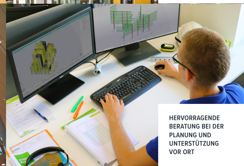
HERVORRAGENDE BERATUNG BEI DER PLANUNG UND UNTERSTÜTZUNG VOR ORT