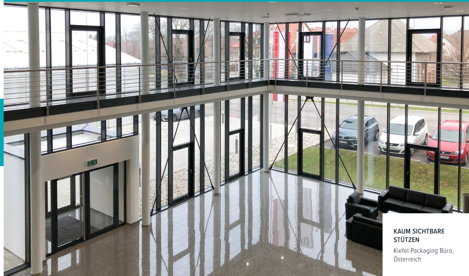
KAUM SICHTBARE STÜTZEN Kiefel Packaging Büro, Österreich

Langjährige, international gesammelte Erfahrung ermöglicht es den Fachleuten von Peikko, die besten Lösungen für Ihre Anforderungen zu finden.