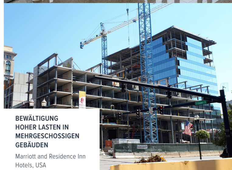
BEWÄLTIGUNG HOHER LASTEN IN MEHRGESCHOSSIGEN GEBÄUDEN Marriott and Residence Inn Hotels, USA