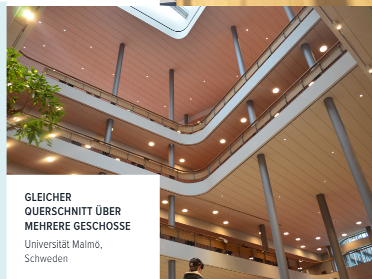
GLEICHER QUERSCHNITT ÜBER MEHRERE GESCHOSSE Universität Malmö, Schweden